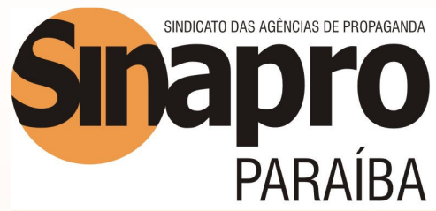
TABELA REFERENCIAL DE SERVIÇOS INTERNOS